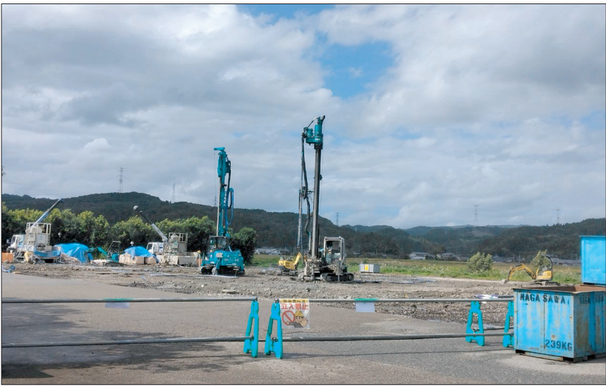
氷見市上田地内の建設現場

南砺市は5日、「五箇 山合掌の里小林家移転工 事」を条件付き一般競争 入札(総合評価方式、事 前審査方式)で開札した 結果、4505万円(予 定価格4511万円)で 安達建設が落札した。 施工場所は田下地内、 工事内容は曳家工事1棟 で、工事期限は令和6年 3月26日まで。